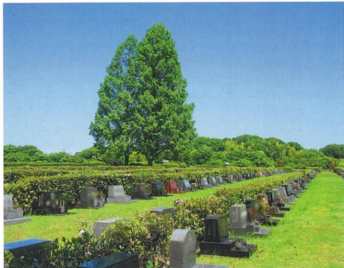
一般墓地(芝生墓地)

令和7年度の合葬式墓地の使用者を募集は5月開始予定です。お墓を継ぐ人がいない方や、子供にお墓の管理等の負担をかけたくない方、終活等で生前に申し込みたい方などに適しています。募集期間は5月10日(土)から翌年3月6日(金)で、生前の方、焼骨の方、名古屋市以外にお住まいの方ともに条件にかかわらず申し込みいただけます。詳細は当園事務所や区役所等に配架中の募集案内書をご確認ください。