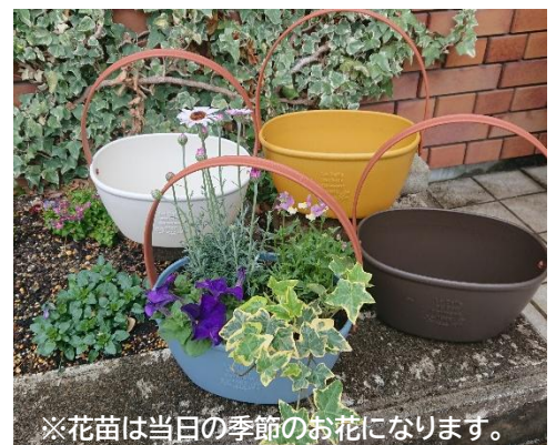
※花苗は当日の季節のお花になります。