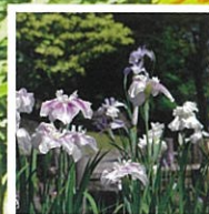
5月下旬~6月上旬 ハナショウブ