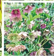
2月下旬~4月上旬 クリスマスローズ

荒子川公園ガーデンプラザは展示会や講習会、散策の休憩などで気軽に寄っていただける施設です。園内では県内でも有数の規模を誇るラベンダー園のほか季節の花や樹木が楽しめます。