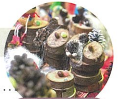
子どもたちのクリスマス作品展