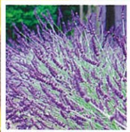
6月中旬 ラベンダー「グロッシ」