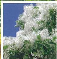
4月下旬~5月上旬 ヒトツバタゴ