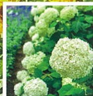
6月 アジサイ「アナベル」