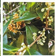
10月上旬 キンギンモクセイ