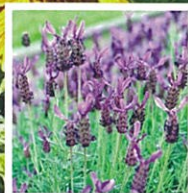
4月 ラベンダー「アボンビュー」