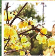
1月~2月 ソシロウバイ