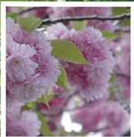
4月中旬 サトザクラ「関山」