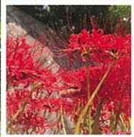
9月下旬 ヒガンバナ