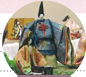
和紙人形の世界展