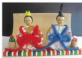
手作りひな人形教室

大学と共催して「春の健康教室」を開催します。他にも様々なイベントを開催しますので、詳細は左のお知らせをご覧ください。