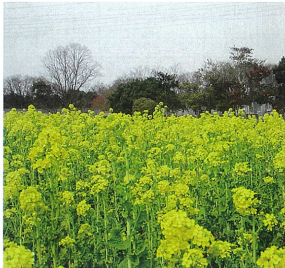
園内を彩るナノハナ

名古屋市内にお住まいの方を含めて、一般墓地と、合葬式墓地の使用者を随時受付中です。