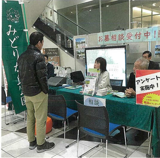
終活セミナーの様子

名古屋市外にお住まいの方を含めて、一般墓地と、合葬式墓地の使用者を随時受付中です。申込方法など詳細については、各区の区役所等に配架中の募集案内や当公園のホームページでご確認いただくか、当園事務所まで