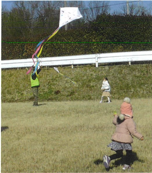
手作り凧あげ教室

新年に向けて12/21(土)に竹や松、南天に梅など縁起の良い植物を組み合わせ、小さな門松を作る「ミニ門松作り教室」を開催します。また、来年の1/11(土)には和紙と竹ひごでオリジナル凧を作り、大空に掲げる「手作り凧あげ教室」や、1/25(土)には双眼鏡の使い方を学び野鳥を観察する「野鳥観察を楽しまう」を開催します。各イベントにご参加希望の方は事前予約が必要です。左のお知らせをご確認ください。