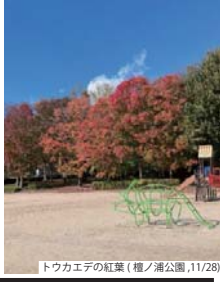
トウカエデの紅葉(樋ノ浦公園、11/28)

秋の花苗 植えつけ(11/16) 3月5日に守山土木事務所に送付した「パートナーシップによる花のまちづくり花苗配布申請書」に基づき、春の花苗を植えつけ(6/13)、今回は前日に運び込まれた秋の花苗(ハンジー56株、ノースポール28株、キンセンカ28株)を植えました。