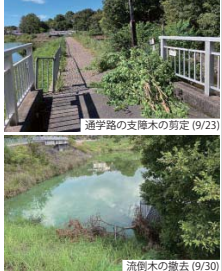
通字路の支障木の剪定(9/23)

来年度以降の「夏だ！元気に遊ぼう会」について 8月24日(土)熱中症警戒アラート発令下、「第18回夏だ！元気に遊ぼう会」の開催中に、熱中症で気分が悪くなった子が2名いました。