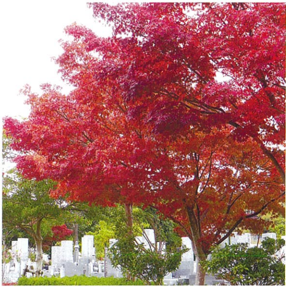
見ごろを迎えたヤマモミジ

名古屋市外にお住まいの方を含め、一般墓地と合葬式墓地の使用者を随時受付中です。申込方法など詳細については、各区の区役所等に配架中の