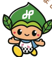
緑区マスコットキャラクター 「みどりっち」