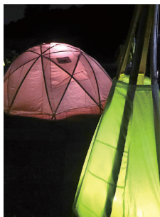
スタードームとムーンタワー

地域の音楽家の皆さんが参加するコンサートや、みどりが丘公園の竹林の間伐材で作成した竹灯りアートのライトアップ、会館内の臨時売店では供花、ローソク、線香などの墓参用品の他、果物等の販売など、秋彼岸イベントを開催します。また、9月21日(土)～23日(月・振)はみどりが丘公園内を園内無料巡回バスが運行します。広い園内の移動には園内無料巡回バスをご利用ください。